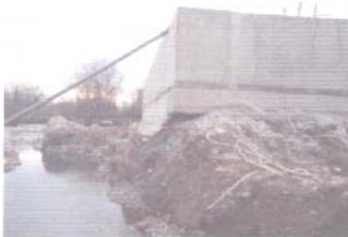
Fotografía N° 16: Se observa que el cauce del canal ha socavado el terreno lateral del estanque de aireación, dejando la estructura en riesgo de colapsar.

3.3.2.4 Se estableció que el estanque de aireación que fuera construido en la planta de tratamiento se encontraba en riesgo de colapsar, ya que la estructura presentaba el socavamiento del terreno lateral al sello de fundación, producto del incremento del cauce del canal durante el período invernal, como se muestra en la fotografía N° 16, sin que la entidad edilicia, a la fecha de la visita, adoptara las providencias del caso para resguardar las infraestructuras ejecutadas.