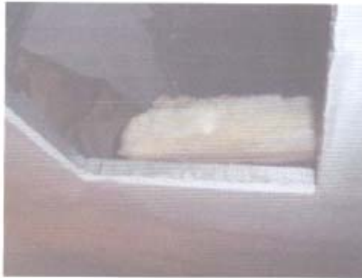
Fotografía N° 8: Se aprecia la existencia de una plancha de cartón-yeso en el tabique de los pabellones quirúrgicos

Sobre la materia, el Servicio informa que lo indicado en el punto 4.2.1., especifica la materialidad para construir los tabiques de la nueva obra y que el elemento construido corresponde a un Shaft para dar cabida a las instalaciones de climatización de los pabellones, los que protegen los sistemas de inyección y extracción del recinto.