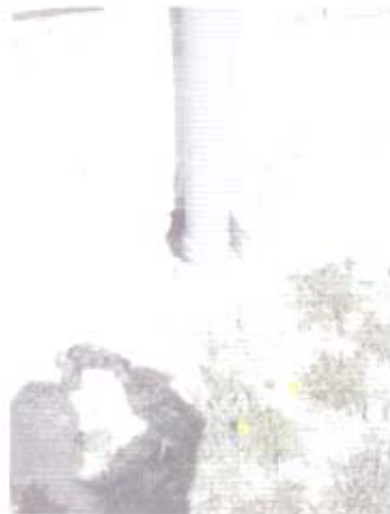
Fotografía N° 28: Se observó la falta de acuciosidad en la ejecución de la instalación del ducto de ventilación en la estructura de hormigón del sobrecimiento.

3.3.3.11. Se constató que la estructura del sobrecimiento, correspondiente al edificio denominado "Zona de Camarines y Baños de Piscina", presenta daño a la materialidad de hormigón, debido a que se retiró parte del material para insertar el ducto de ventilación de la red de alcantarillado que no fue instalada oportunamente en la mencionada estructura, lo que constituye un incumplimiento de lo señalado en la letra b), del numeral 10 "Colocación", de la Norma Chilena N° 170, Of. 85, como se muestra en la fotografía N° 28.