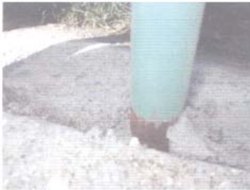
Fotografía N° 26: El perfil metálico de la reja perimetral de la piscina, se observa el grado de oxidación que presenta por la falta de la pintura anticorrosivo.

3.3.3.8. En la base de los perfiles metálicos del cierre perimetral de la piscina, se advirtió un alto grado de oxidación, producto de la ausencia de la pintura anticorrosivo, por lo que el contratista no dio cumplimiento con lo señalado en el punto 12.11.1., denominado "Esmalte Sintético y Anticorrosivo", de las especificaciones técnicas, como se muestra en la fotografía N° 26.