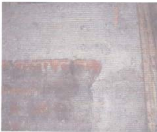
Fotografía N° 12: Se observa que la cantería de la albañilería no poseía el mortero de pega.

3.3.2.2. Las canterías de las albañilerías correspondiente a las sala de cloración y bodega de los productos químicos, presentaban la falta del mortero de pega, como se muestra en la fotografía 12, por lo que la empresa constructora no dio cumplimiento con lo señalado en la letra b), del punto 9.3. "Inspección de Obra", de la Norma Chilena Oficial NCh 2123. Of 1997, Modificada en 2003, denominada "Albañilería Confinada- Requisitos de Diseño y Cálculo".